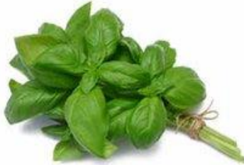
ALBAHACA / DIRECTO