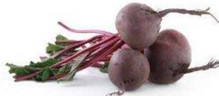
BETARRAGA / DIRECTO