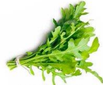
RÚCULA / DIRECTO