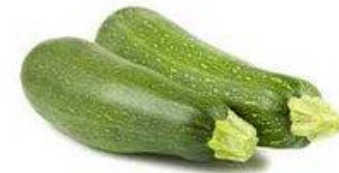
ZAPALLO ITALIANO / DIRECTO