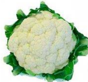
COLIFLOR / DIRECTO