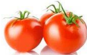
TOMATE / ALMÁCIGO