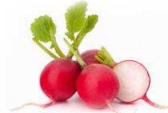
RABANITOS / DIRECTO