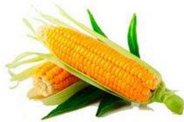
MAÍZ / DIRECTA