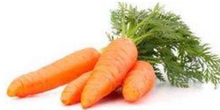
ZANAHORIA / DIRECTO