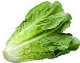
LECHUGA / ALMÁCIGO