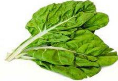
ACELGA / DIRECTO